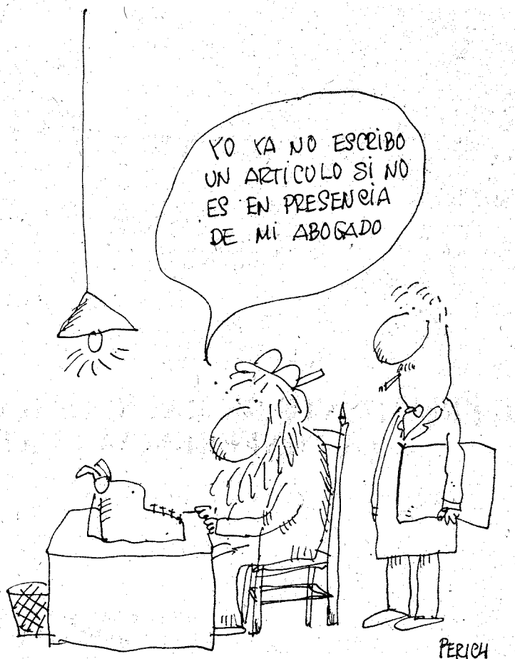
(Prohibida la reproducción sin autorización expresa de «La Vanguardia»)